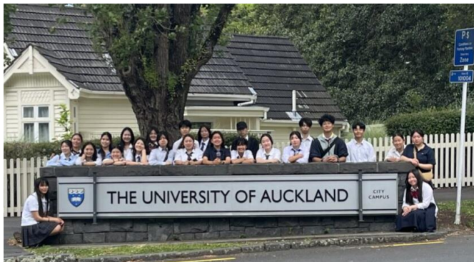
【オークランド大学】

寮での留學の振り返りの中では、グループに分かれ、留學中に直面した課題や問題、留學の経験を通して学んだことや成果について英語で報告しました。研修生の中には、「自分に自信がもてるようになった。」と笑顔で報告しており、とても充実した留學生活だったことが垣間見えました。