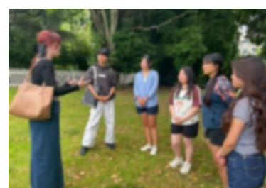
【特別プログラム中の様子】